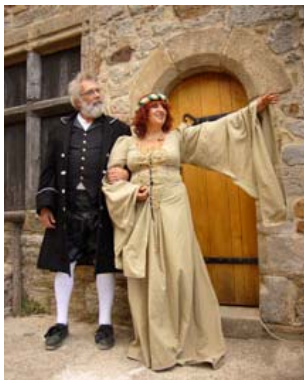
Le Marquis et la Marquise de Budos en représentation

Les journées « portes ouvertes » sur le chantier le 15 août ont suscité l'intérêt de près de 100 courageux qui ont bravé le mauvais temps pour écouter les explications des équipes du chantier sous l'œil attentif de France 3 et plus de 900 curieux se sont pressés lors du week-end des journées européennes du patrimoine. La foule était également nombreuse lors de la prestation aérienne d'Antoine le Ménéstrel qui a offert un spectacle époustouflant sur les façades du Château neuf, grâce au concours financier du Pays grand'combien.