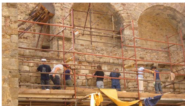
Le mur intérieur de la cour lors de son rejointoiement

Les points de chantier de cette saison ont été particulièrement nombreux et variés. Suite aux travaux de mise aux normes du presbytère, les bénévoles ont entrepris quelques travaux dans la salle de repos afin de la rendre plus agréable. Les scouts ont, quant à eux, procédé à de nombreux travaux d'entretien, citons entre autre la réalisation d'une balustrade sur la galerie