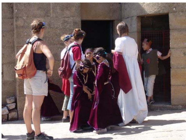
Pour la visite du Château, les enfants portent des costumes de chevalier et de reine

Le Château de Portes ne pouvait qu'être associé à cette opération de découverte de l'histoire et du Patrimoine sur un principe simple : les enfants et leurs animateurs ont passé la journée sur place, dans un cadre magnifique (châtaigneraie et Mont Lozère) afin de participer à des ateliers et de visiter sous forme ludique le bastion des Budos. Le thème de ces journées était celui de la Tolérance. La Tolérance vis-à-vis de l'autre, des religions, de la différence.