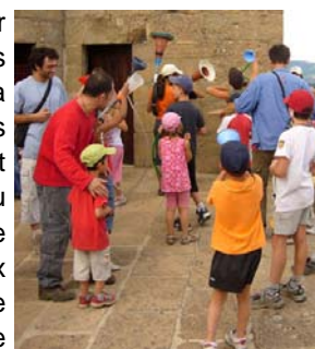
Atelier de percussions sur la terrasse