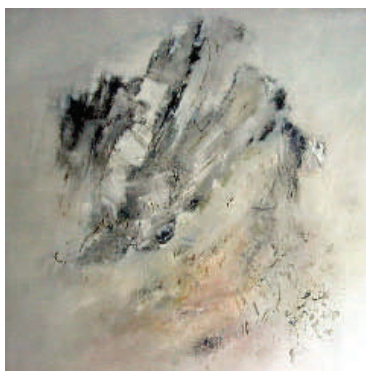
Sans titre - T. Roualet

Entre nous, si vous souhaitez exposer en 2007, il faut vous manifester dès à présent, le château étant de plus en plus demandé.